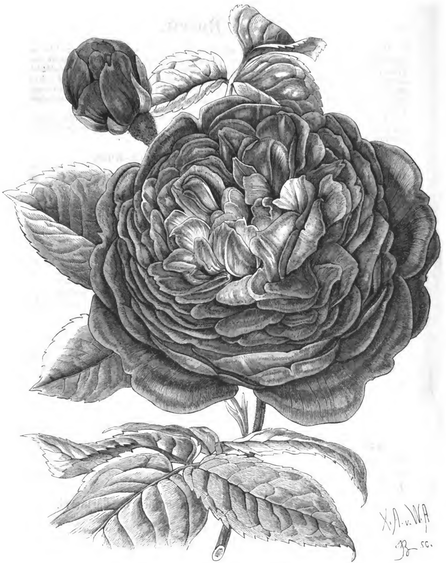
Remontant-Rose „Reine des Violettes“, in natürlicher Form und Grösse, nach des Züchters Zeichnung.